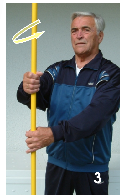
3 senkrecht vor dem Körper kreisen ein- oder beidarmig