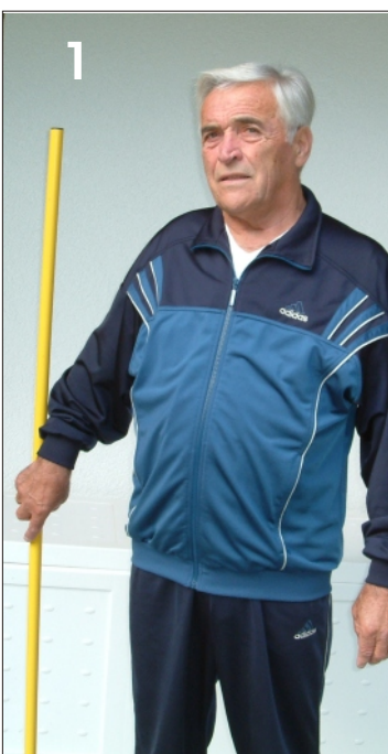
1 um den Körper kreisen abwechselnd links und rechts